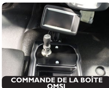
COMMANDE DE LA BOÎTE OMSI